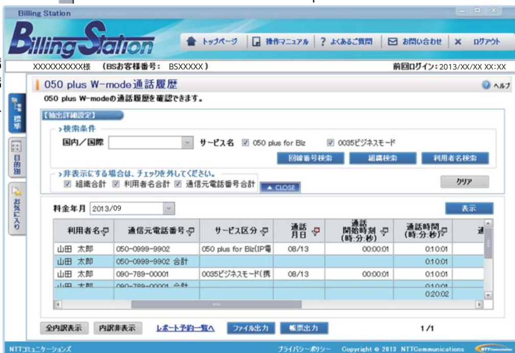
(050 plus W-mode通話履歴画面)